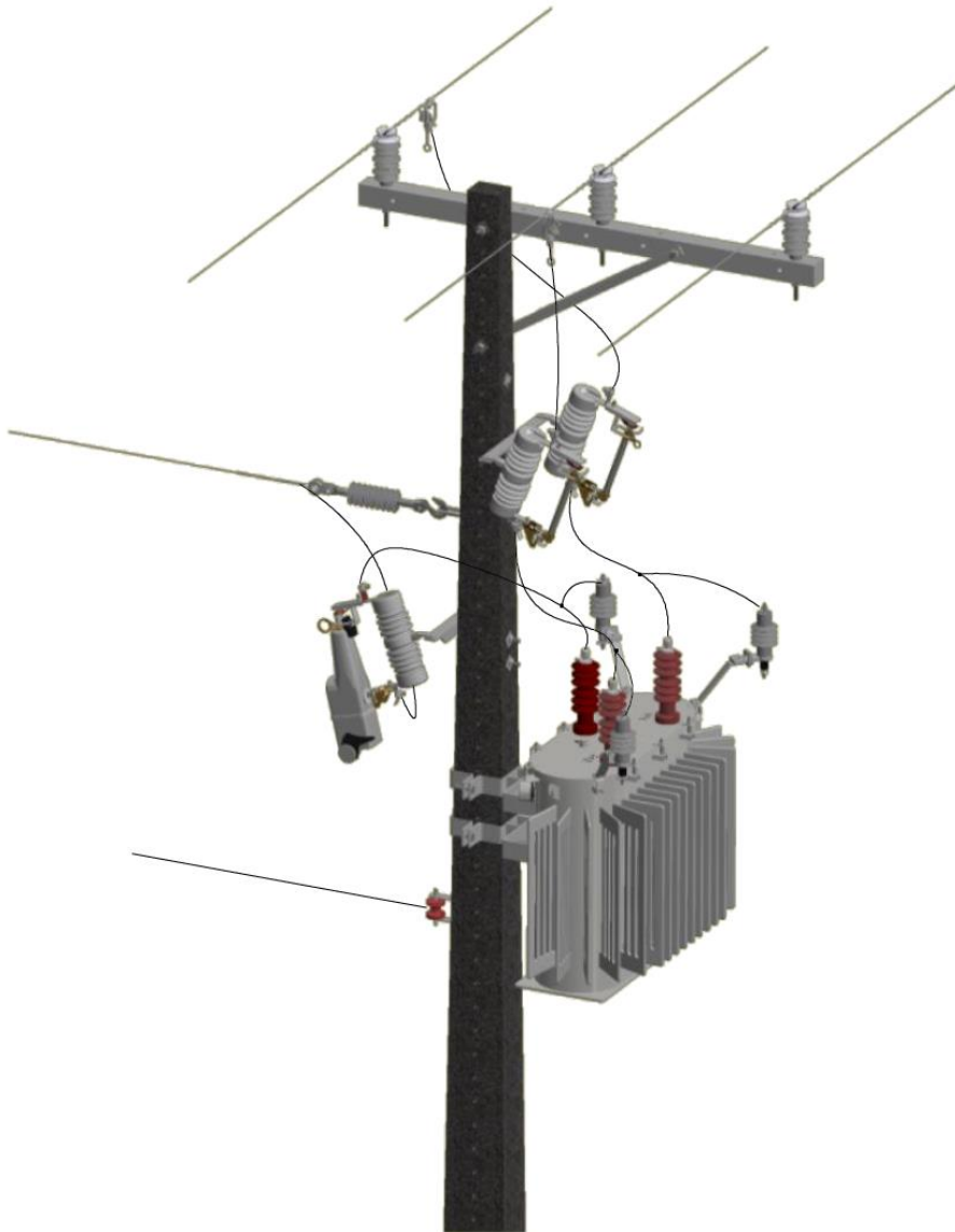
VISTA EM PERSPECTIVA

Linha de Negócio: Infraestrutura e Redes